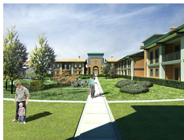
Viale pedonale centrale - vista da accesso Sud