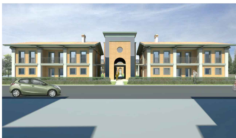
Vista lato Sud